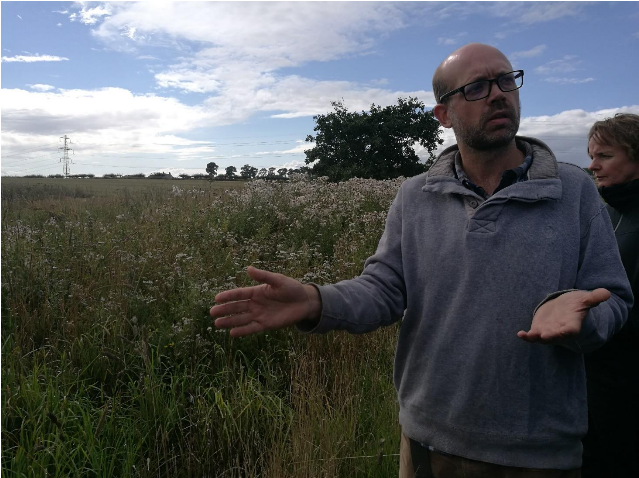
Høst af biomasse i randzoner, som skal være med til at øge jordens kulstofindhold og optage næringsstoffer.

Der blev i øjeblikket gjort forsøg med at høste biomasse i randzonerne for at øge markjordens kulstofindhold og optage næringsstoffer. Der er dog både økonomiske og biologiske udfordringer ved dette. Høsttidspunktet er bl.a. afgørende for at undgå at slæbe ukrudtsfrø ind på dyrkningsjorden. Rent økonomisk skal metoden nok tillægges andre biologiske miljøfordele, da sandsynligvis ikke ville kunne konkurrere med indkøb af gødning. Det er en mulighed og lige nu undersøges effekterne.