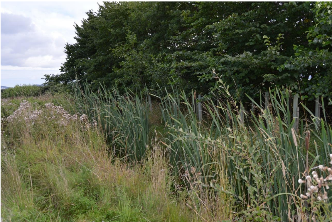
Intelligent bufferzone med elletræer 3 år efter etablering (2015). I grøften ses allerede kraftig vækst af dunhamre.