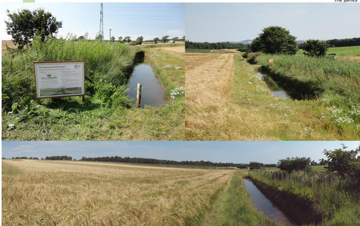
Intelligente bufferzoner 6 måneder efter etablering i 2015.

Elletræer kan høstes efter ca. 20 år og fordelene ved elletræer frem for pil er at de er nemmere at høste med nuværende høstestyr, da der kun er en stamme at tage fat i for en skovmaskine. Pilen vil her være vanskeligere, da disse består af mange stammer. Elletræerne kan skyde fra stammen igen, men spørgsmålet er så om den i år 40 efter rodkud er nem at høste – det må tiden vise. Når der etableres miljøtiltag af denne type er det vigtigt samtidigt at tage stilling til, hvordan de kan høstes, ofte har mange skovmaskiner en begrænset arbejdsbredde. Tiltagene skal derfor ikke have en for stor bredde. Ved en intelligent bufferzone skal en skovmaskine kunne række ind over grøften og skove træerne. En maksimal arbejdsbredde vurderes til at være omkring 10 meter på de nuværende maskiner.