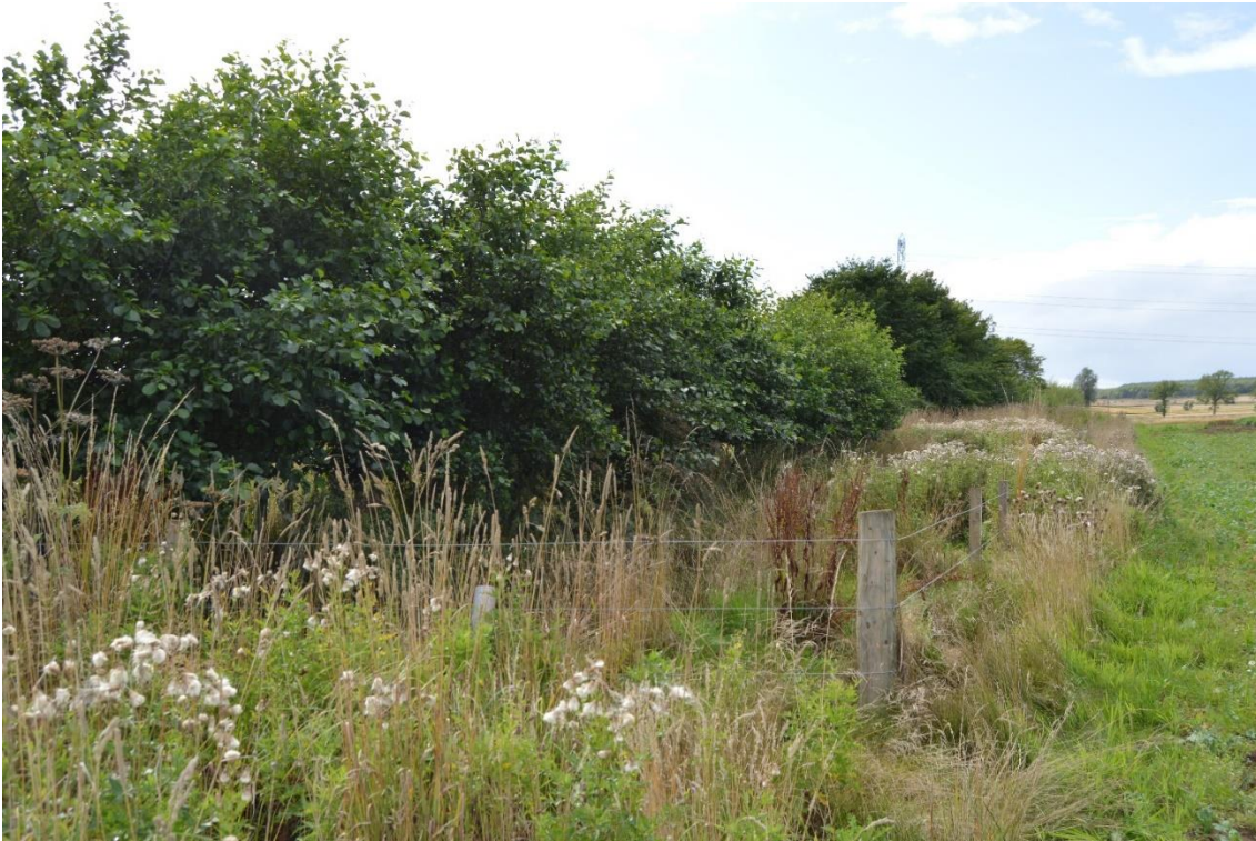
Intelligent bufferzone med elletræer 3 år efter etablering (2015).