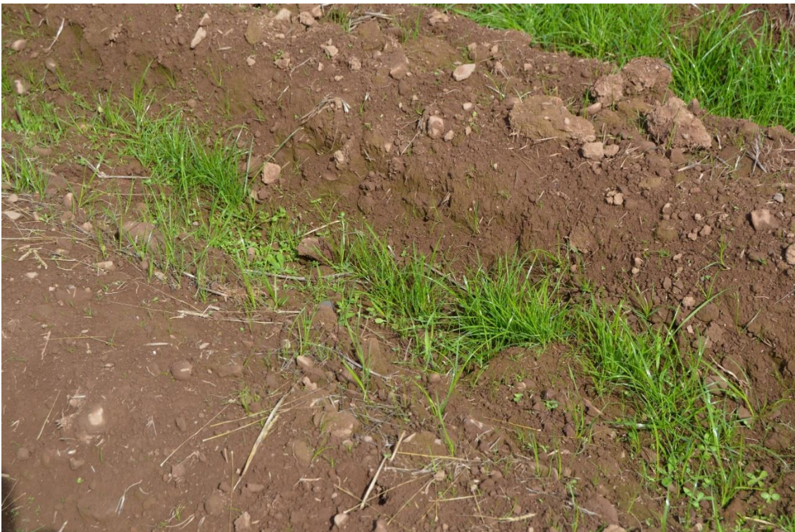
Kontrol af jorderosion ved skiftevis lavninger og forhøjninger i rillerne ved siden af kammene.