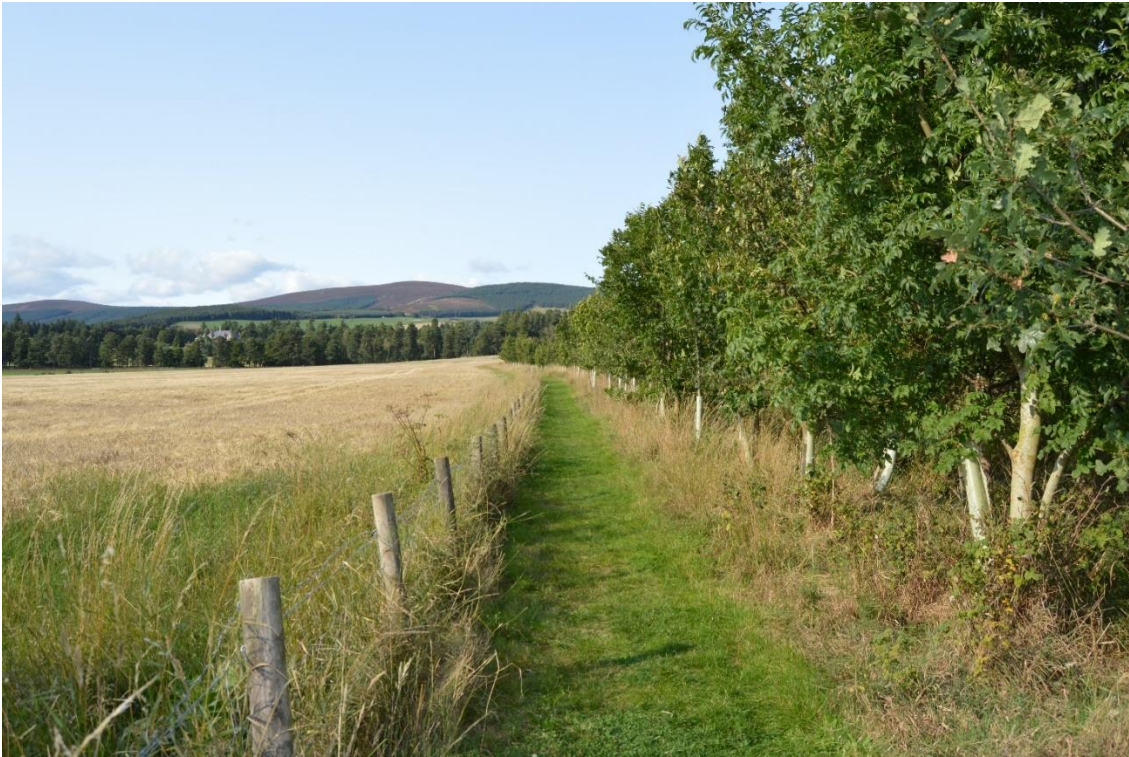
Randzone med offentlig adgang og træer langs vandløbet ved floden Dee.