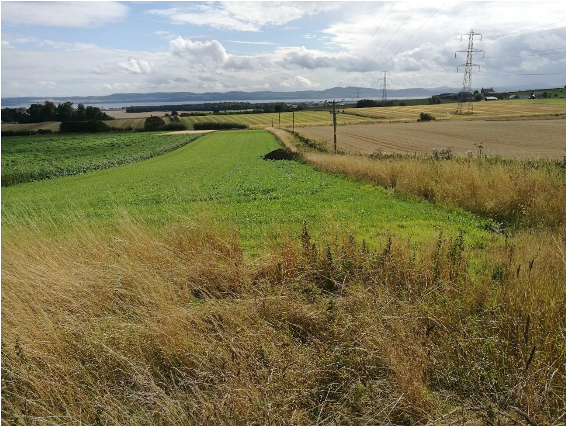
En del af forsøgsmarkerne på i alt 42 hektar.

Den danske delegation blev også præsenteret for et sædskiftforsøg (Integrated Management System), hvis formål var at optimere til at optimere et sædskifte (vårbyg, kartofler, vinterhvede, vinterbyg, vinterraps og stangbønner), på en måde så der blev opnået et optimalt forhold mellem input og udbytter på den ene side og miljøet, biodiversiteten og jordstrukturen på den anden side. Mellem 3 og 5 forskellige sorter af hver afgrøde blev testet i forsøget der kørte fra 2011-2016. Udover sædskiftet blev der også eksperimenteret med genanvendelse af plantegødning, mellemafgrøder, bedre håndtering af ukrudt og forskellige former for IPM og IDM-løsninger (Integrated Pest and Disease Management)