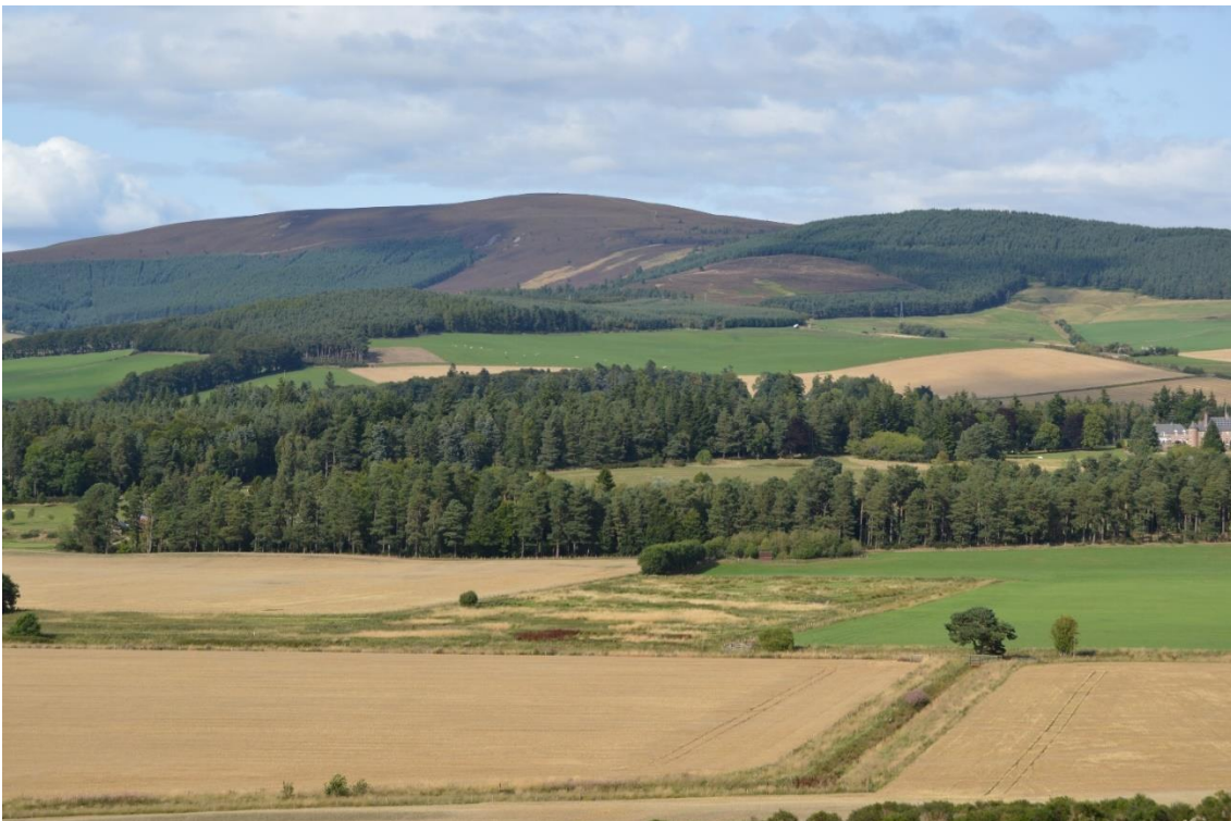
Randzone med græs ved floden Dee.