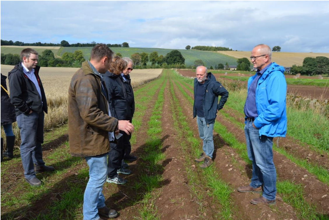
Kamme og riller med dækning af græs til kontrol af jorderosion.