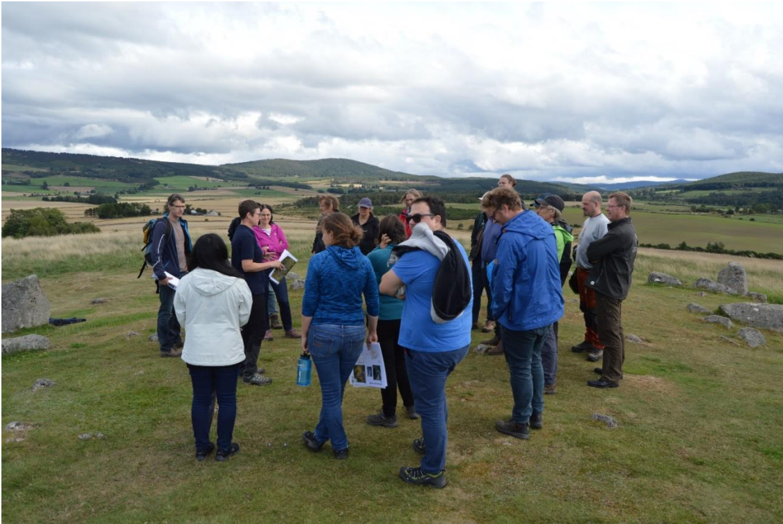
BufferTech møde på gravhøj med udsigt til randzonerne ved River Dee.