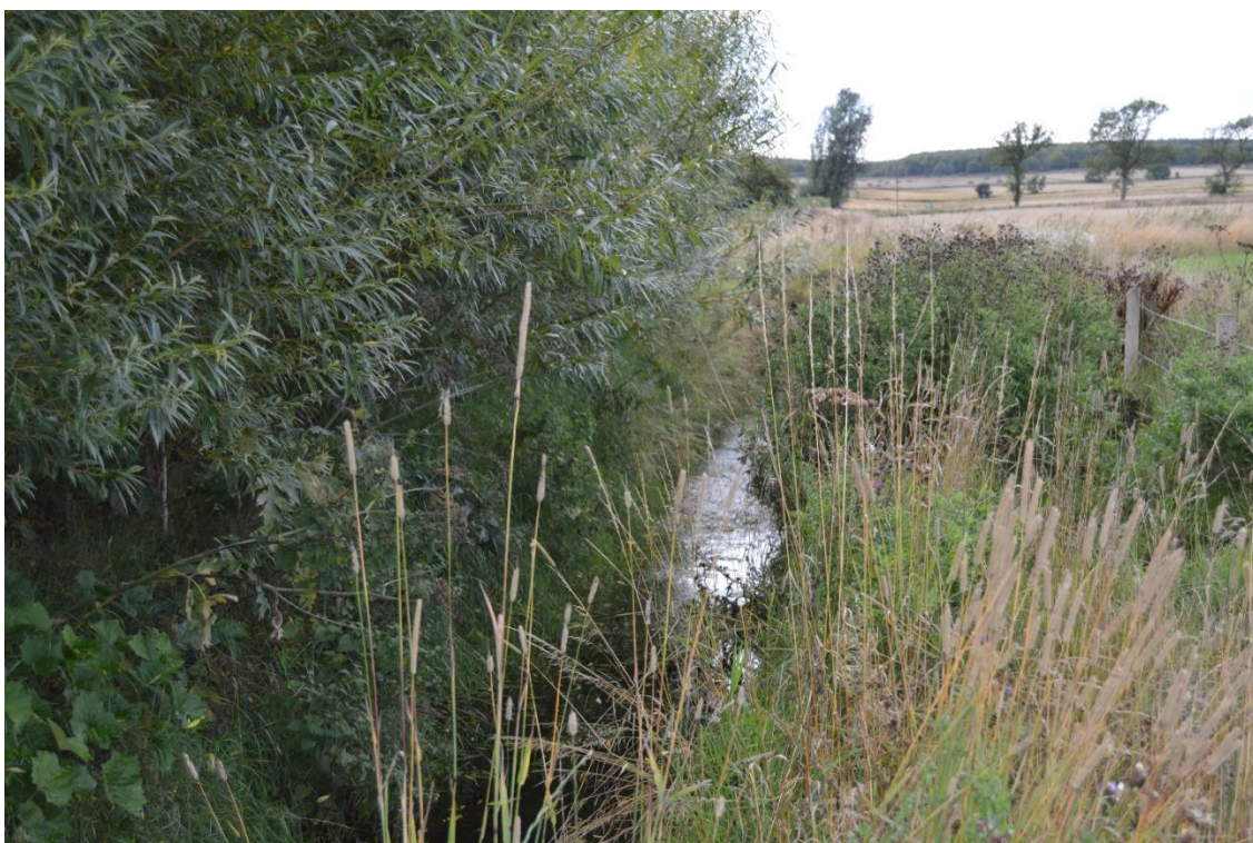
Intelligent bufferzone med pil 3 år efter etablering (2015).