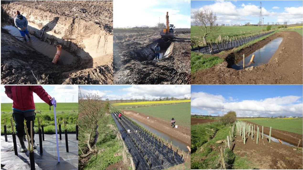
Intelligente bufferzoner etableret i 2015 på The Centre for Sustainable Cropping i Balruddery.